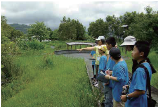
找一找水生植物有哪些？