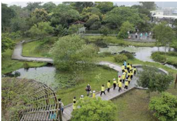
在大自然教室中體驗水的旅行

本園區位於宜蘭縣員山鄉，面積23公頃，興建於民國21年，其中17公頃以上保留原始自然生態，是一座以「水」作為主題的互動體驗生態園區，也是擁有多種動植物、昆蟲與濕地生態的自然教室。各式各樣的親水課程活動，能讓你我重新找回人與水的親密關係，將正確的水生態、水文化、水知識、水安全的觀念傳達給每一個人。