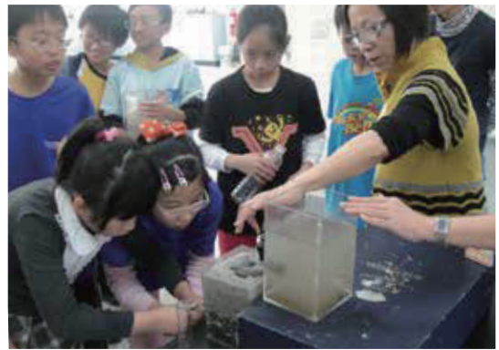
原來乾淨的自來水是這麼來的呀！