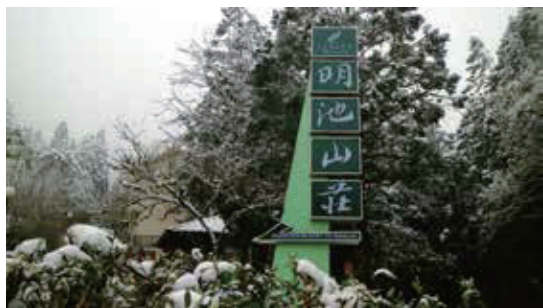
明池山莊停車場入口

明池舊名池端，位於泰雅古道，1910年日治時期伐木作業，1959~1962年間退輔會將林道轉變為公路，1961年明池設立苗圃，進行苗木培育作業，1992年開始禁伐天然林，明池轉型森林遊樂區營運，2000年棲蘭野生動物重要棲息環境，2015年力麗觀光接手後，積極推動推動環境教育。