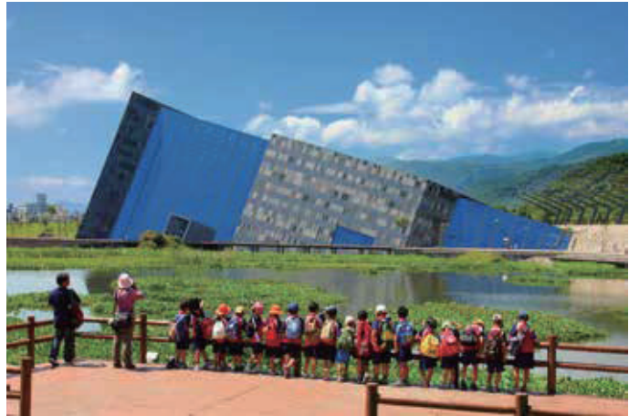
蘭博園區是清代烏石港舊址，溼地面積約4.4公頃，水中矗立烏石礁與單面山造型的建築相呼應。東邊緊鄰烏石漁港與太平洋及龜山島相望(作者：利勝章)

藉著保存並維護宜蘭的自然與人文環境，結合宜蘭博物館家族夥伴，共同整合在地資源，實踐「宜蘭是一座博物館」的理念，推動地方生態文化與環境永續發展，規劃「來蘭博玩環教」、「博物館入校園」等環境教育相關課程與活動，希冀守護豐富及多元的蘭陽文化與環境生態，營造成快樂學習及沉浸在地文化與環境教育的場域。