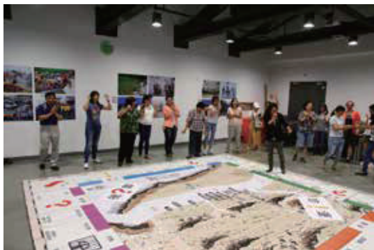
走入園區水域(溼地)認識烏石礁，讓學員親眼觀察烏石港地名由來