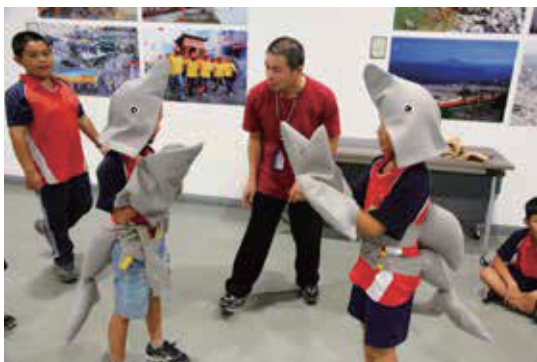
利用道具模仿鯨魚的演化過程