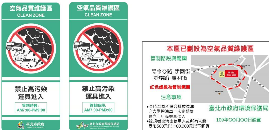
圖 1 標示型式（範例）

為充分向社會大眾說明或提醒空氣品質維護區相關規定，可參考如圖 1 與圖 2 之空氣品質維護區標示與告示牌。其中標示圖示應與圖 1 一致，文字內容得視管制措施調整；告示牌內容應至少包括：空氣品質維護區告示、管制區域與範圍（含地圖）、管制注意事項（管制措施與處分方式）與設置單位。前述標示與告示牌涉及尺寸、材質、設置位置等，得因地制宜設置，惟設置前應取得各縣市管理單位同意；另設置提醒道路車輛使用者，距離應參考道路交通標誌標線號誌設置規則（如一般道路約 300 公尺前明確標示之；快速公路、高速公路應於 1,000 公尺前明確標示之），並以離地設立為原則。