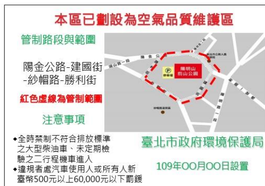
圖 2 告示牌型式（範例）