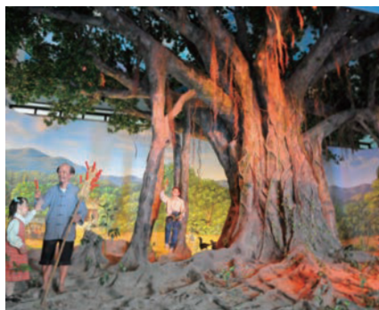
保育教育館1F大廳生命樹栩栩如生，讓民眾嘆為觀止