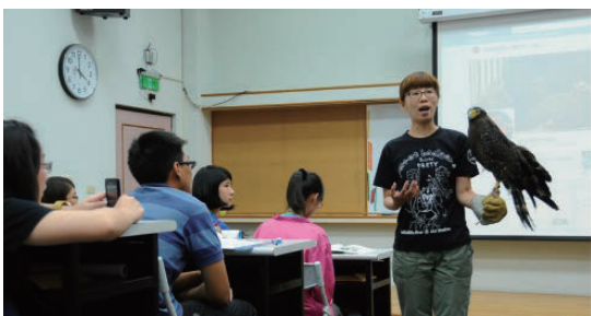
保育員進行野生動物SOS課程，述說大冠鷲救傷的過程

為甚麼是「慕光之城」？蛾是甚麼東東？蛾和蝶有甚麼差別？蛾在生態系扮演甚麼角色？蛾和人類有甚麼關聯？有哪些人研究臺灣的蛾類？