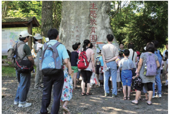
有3.5公頃的生態教育園區，提供戶外學習優質場域

另外為落實推動鄉土生態教育，喚起民眾重視並愛護本土生物之特殊與珍貴性，以人工埭地整建手法關建「生態教育園區」3.5公頃，並配合全園地形，區分為變色植物區、溪流生態區、常綠闊葉林區、蜜源植物區、草澤與水塘生態區、人工造林樹種區、珍貴稀有植物區及特用植物區等，全區栽植的臺灣特有或原生植物達600餘種10,000多株。園區之導覽設計為自導式雙語解說設施，並提供園區導覽摺頁供遊客使用。本中心野生動物急救站將救傷的野生動物，因無法野放成為保育大使於園區開放民眾參觀，是優質的環境教育學習場域。