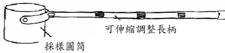
圖二 手動採水設備（二）