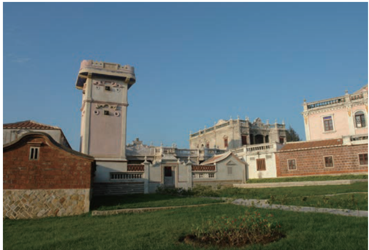
美麗的水頭聚落，保存了完善的閩南建築與僑鄉文化

金門國家公園成立於民國84年10月18日，為我國第6座國家公園，亦是國內首座以維護歷史文化資產與戰役紀念為主兼具保育自然生態的國家公園。園區範圍3528.74公頃，佔大小金門約1/4面積。區域內有豐富的傳統聚落與人文史蹟、重要的戰役紀念地及自然生態資源。傳統聚落中，疊合了「閩南文化」、「僑鄉文化」及「戰地文化」三種不同時代文化層，人與自然的關係和諧，是最佳的环境教育場所。