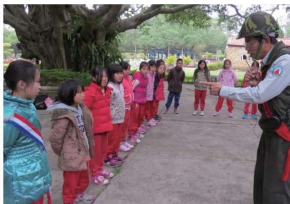
「新兵日記」課程，帶領學生認識金門的戰地文化