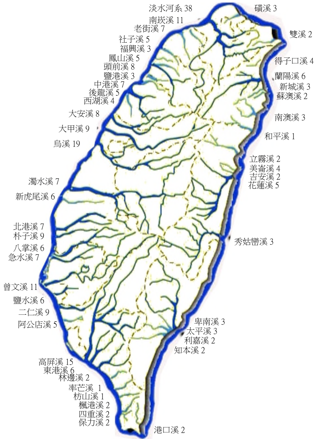
圖 4 50 條重要河川水質監測站分布 (112 年底監測站數計 288 站)