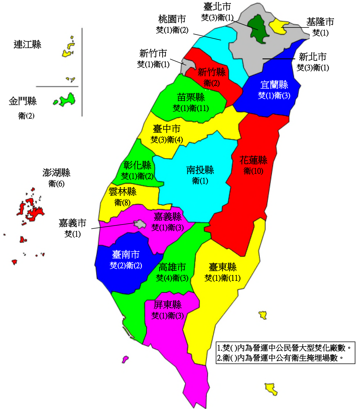
圖 5 垃圾處理場(廠)分布