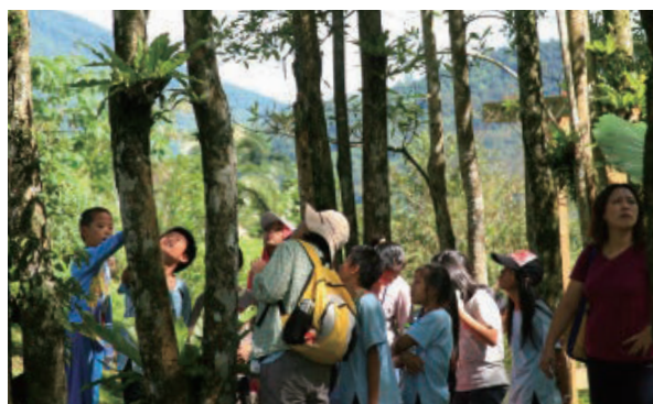
池南自然教育中心為熱帶闊葉樹林分佈，天然林植群及人工植群分佈層次分明，為森林環境教育最佳場所。