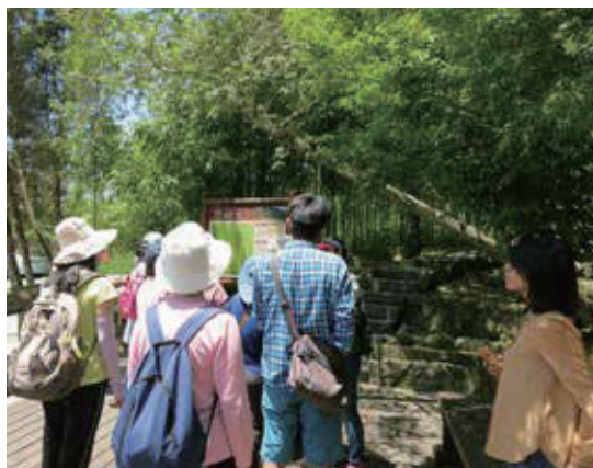
暢遊在森林步道，吸收芬多精來場森林浴！

時代的變遷，原住民族與少數民族的傳統生活方式也產生改變，許多的歲時祭儀已逐漸變成官辦而帶有文化觀光的意味，但原住民族仍努力的在各項祭典中重現傳統文化內涵，藉由祭典的舉行來標誌整個族群的主體性，使祭典成為一種族群文化認同的標誌，亦成為台灣原住民傳統文化的主要精神象徵。