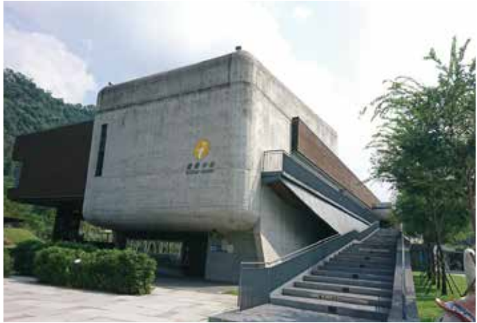
位於觸口大門的阿里山國家風景區環境教育中心，經過這邊就正式進入阿里山區

阿里山環境教育中心絕不讓學員只在室內感受自然，而是沿著台18線前往秘境，感受阿里山帶來的美感衝擊；你可以在雲霧繚繞的森林步道中穿梭遊走，令人心身暢快；或是親手製作鄒族文化產品，感受最真實的人文脈動，在這裡，我們所提供的課程將讓學員更加認識大阿里山。