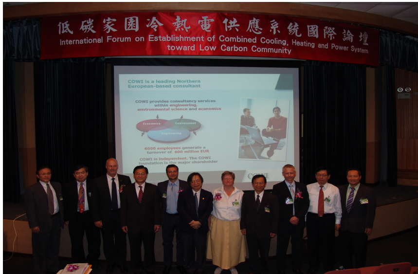
▶ 環保署沈署長(右四)與低碳家園冷熱電供應系統國際論壇與會代表

區域性示範計畫、調整合理之能源價格，以促進熱冷電供應並達成整體最高能源效率目標。