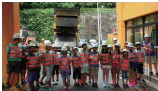
探索體驗-垃圾車操作員