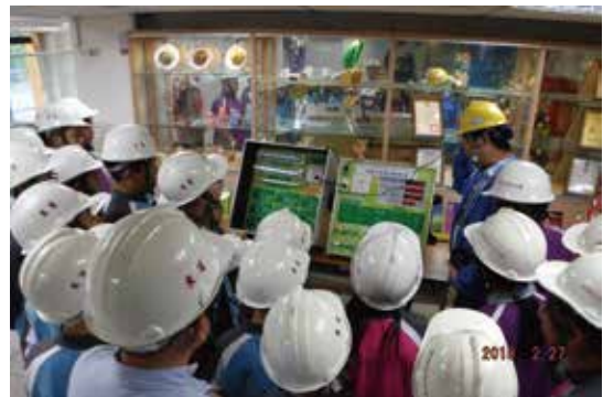
綠活旅行家-綠活旅人