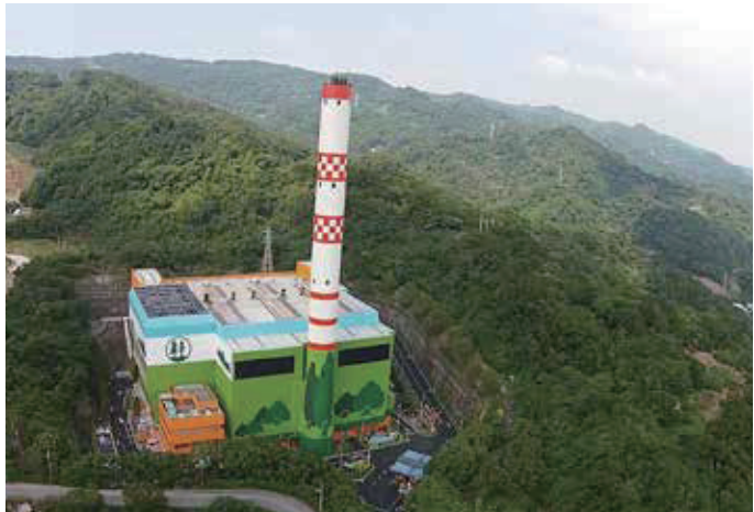
樹林垃圾焚化廠全景

樹林垃圾焚化廠不僅是一座垃圾去化工廠，更是以環境工程、環境教育等力量多管齊下，解決都市廢棄物問題的無名英雄，秉持「人文與生活」、「資源與生態」及「關懷與責任」的傳承而努力。樹林垃圾焚化廠榮獲環保署頒發「環境教育設施場所優異」、「國家環境教育獎」等殊榮，以多元的教學法，配合各年齡層規劃設計出多套系統化的環境教育課程，以滿足學員多元的學習需求，讓學員成為環境貢獻心力的守護天使，深耕環境教育種子，是地方居民學習、互動、聯誼的好厝邊。