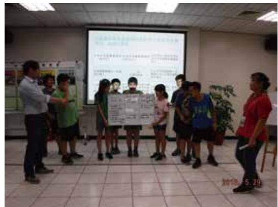
遊「垃」園尋寶趣-樂寶總動員