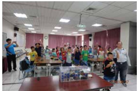
守護天使-我的學習護照