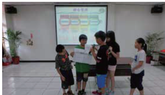
環境變遷-垃圾變變變-學員分享

在探索體驗的課程中，有個讓學童自行觀察想像比對垃圾燃燒後的樣子，可以自行從垃圾原樣及焚燒後底渣樣品中去比對出原始/燃燒後的樣子，當然這些容易比對出來的廢棄物多半屬於不適燃或不可燃的廢棄物，因為焚化(燃燒)作用對這類的廢棄物多半無法燒透或改變其物質特性，如金屬(鐵、銅、金等)、陶瓷、磚瓦、砂石等。