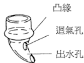
圖一 冷凝蓋參考示意圖